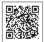
だいがくにゆうがく し かく 大学入学資格について

※上記(1)~(5)の「外国における12年または11年の課程」には、日本の学校教育法に基づく小学校・中学校・高等学校等に在籍した期間も含まれるが、その場合は在籍期間が通算3年以内であること。 ※日本の大学への入学資格は、文部科学省のサイトを参照してください。